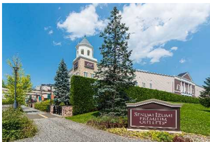
▲仙台泉プレミアム・アウトレット (宮城)