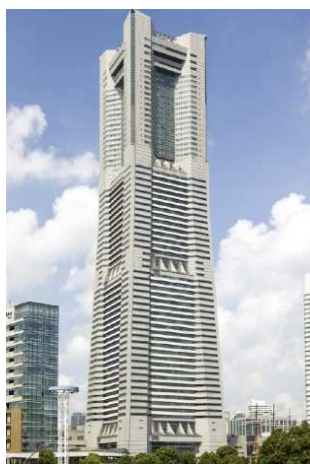
▲横浜ランドマークタワー (神奈川)