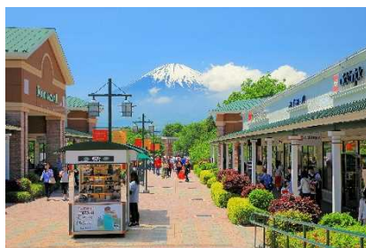
▲御殿場プレミアム・アウトレット (静岡)