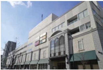
▲maruyama class (北海道)