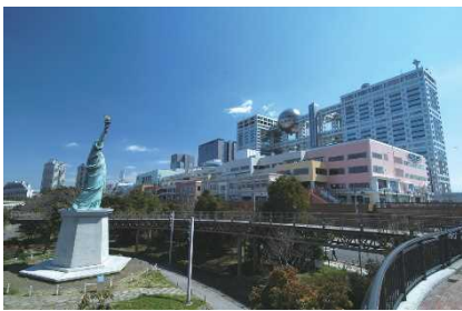
▲アクアシティお台場 (東京)