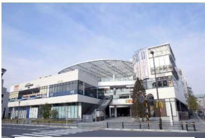
▲ポルテポルト千住 (東京)