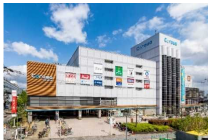
▲COROWA 甲子園 (兵庫)