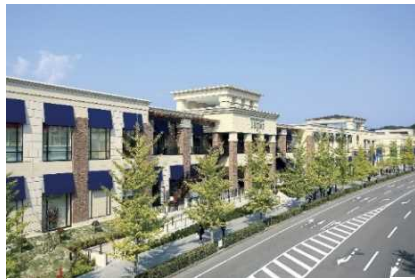
▲泉パークタウン タピオ (宮城)