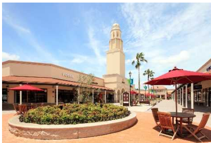
▲あみプレミアム・アウトレット (茨城)