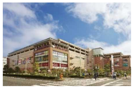
▲南砂町ショッピングセンターSUNAMO (東京)