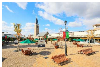
▲土岐プレミアム・アウトレット (岐阜)