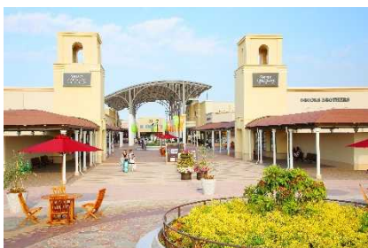
▲酒々井プレミアム・アウトレット (千葉)