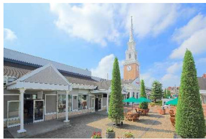
▲佐野プレミアム・アウトレット (栃木)