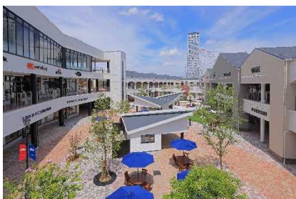
▲りんくうプレミアム・アウトレット (大阪)