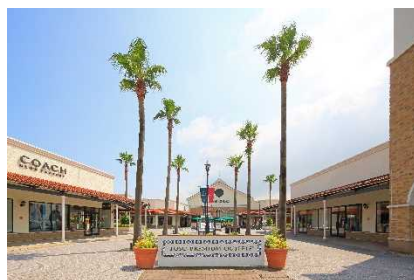
▲鳥栖プレミアム・アウトレット (佐賀)