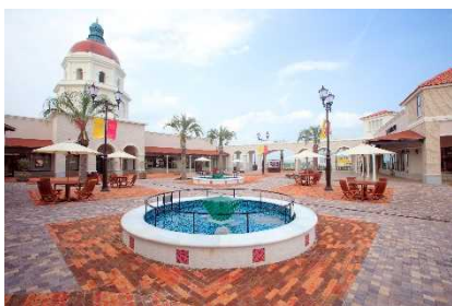
▲神戸三田プレミアム・アウトレット (兵庫)