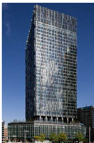
▲大名古屋ビルヂング (愛知)