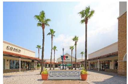
▲鳥栖プレミアム・アウトレット (佐賀)