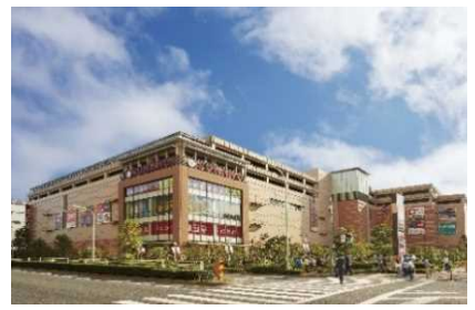
▲南砂町ショッピングセンターSUNAMO (東京)