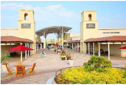
▲酒々井プレミアム・アウトレット (千葉)