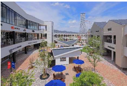
▲りんくうプレミアム・アウトレット (大阪)