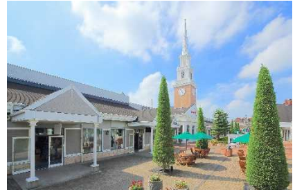
▲佐野プレミアム・アウトレット (栃木)