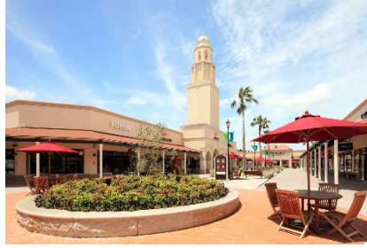
▲あみプレミアム・アウトレット (茨城)