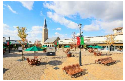
▲土岐プレミアム・アウトレット (岐阜)