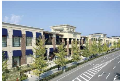
▲泉パークタウン タピオ (宮城)