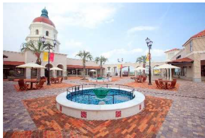
▲神戸三田プレミアム・アウトレット (兵庫)