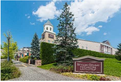
▲仙台泉プレミアム・アウトレット (宮城)