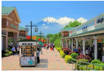
▲御殿場プレミアム・アウトレット (静岡)